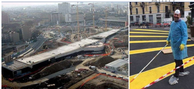
2009 TUNNEL A SCORRIMENTO VELOCE

https://blog.urbanfile.org/2019/04/04/milano-nolo-davanti-al-trotter-si-sperimenta-lurbanesimo-tattico/?fbclid=IwAR3IAykBjmlvVXgaacuPcIK-W9czBF7Cr4eSFbhjs9jSSd57MELouvuCuf4