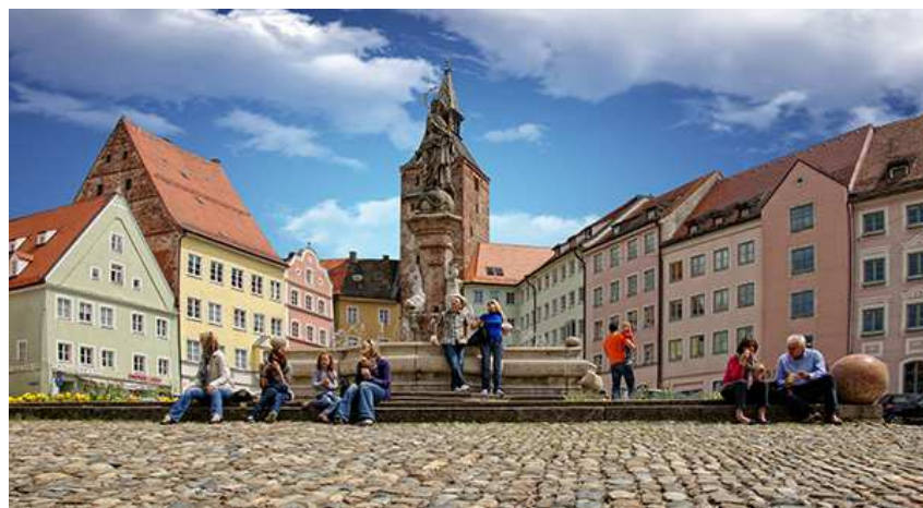
La città di Landsberg