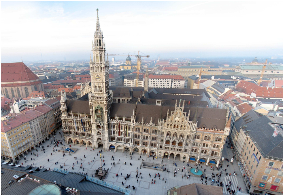
Marienplatz, Monaco di Baviera