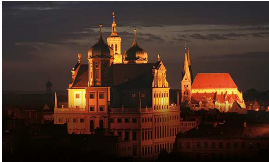
Augusta, una delle più antiche città della Germania