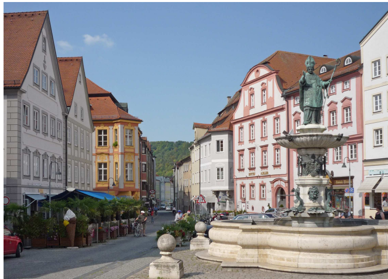
Eichstatt, piazza mercato