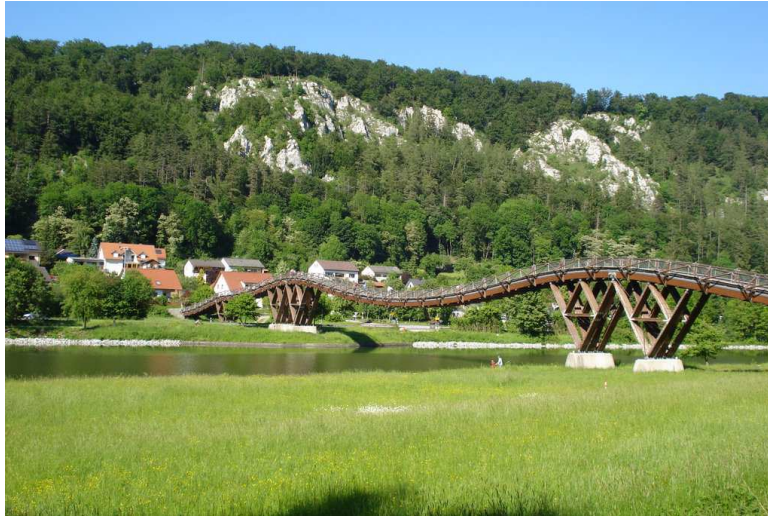
Essing, ponte di Legno più lungo d'Europa sull'altmühl