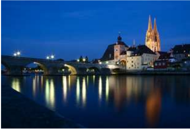
Passeggiata serale a Ratisbona