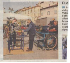
Due in ciclo. Valca, l'alta bresciana, è sempre più frequentata dai ciclisti.