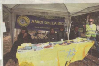
Un'iniziativa degli Amici della Bicicli nello scorso anno.

Una campagna di sensibilizzazione per la sicurezza dei cittadini bresciani amanti delle due ruote si chiama «Sicuri in bici». L'iniziativa è promossa dai Bicicli «Conrado Pavanella» che si articola in quattro filoni tematici: città evento, cultura, sicurezza e mobilità.